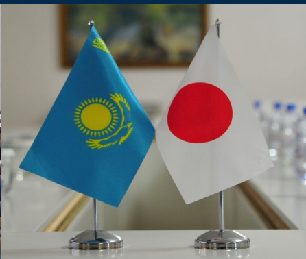
Эксперты Японии и Казахстана обсудили «Сотрудничество в области энергетики и экологии»