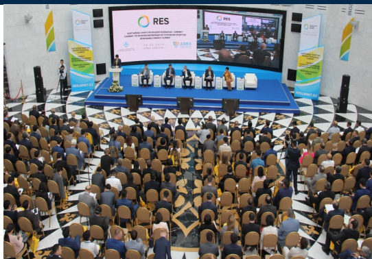
Асет Магауов принял участие в саммите по ВИЭ