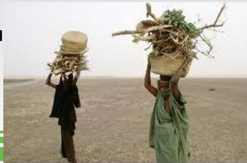
Women and girls are recognized as key natural resource users and managers, particularly for water, fuel wood and farming.