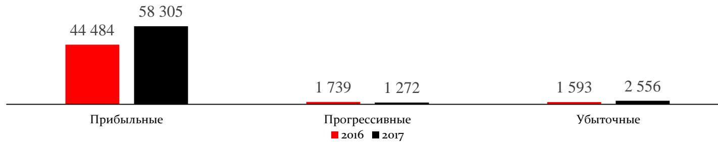
Добыча нефти в разрезе 3-х групп недропользователей, тыс. тонн